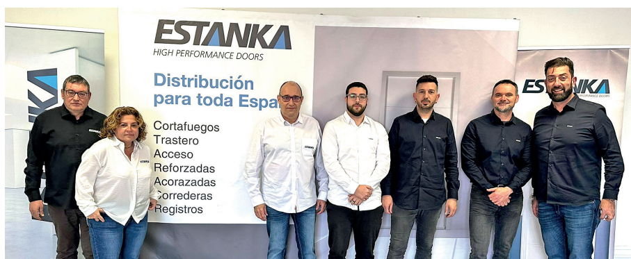
▲ Equipo comercial ESTANKA.

Desde el año 2018 vendemos Puertas a nivel nacional pudiendo desarrollar cualquier tipo de proyecto y dando un servicio inmediato tanto de asesoramiento como de precio. Somos el complemento perfecto para cualquier empresa dedicada a la venta de Puertas de obra y estamos homologados por la mayoría de los grupos de compra de la construcción, así como también por las grandes cooperativas nacionales del canal de ferretería.